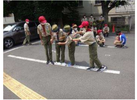
午後は杉並3団が合流。 まずはアイスブレイクで交流ゲーム。