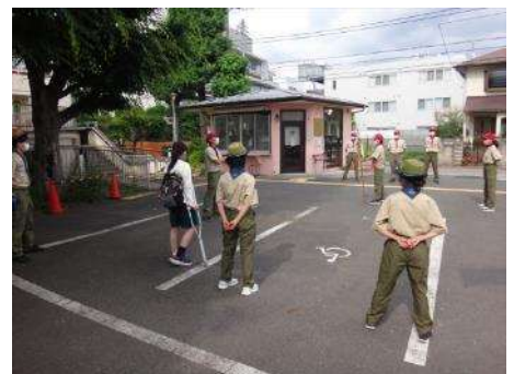
青空会議で、合同で行う夏キャンプのプログラムや献立を協議しました。