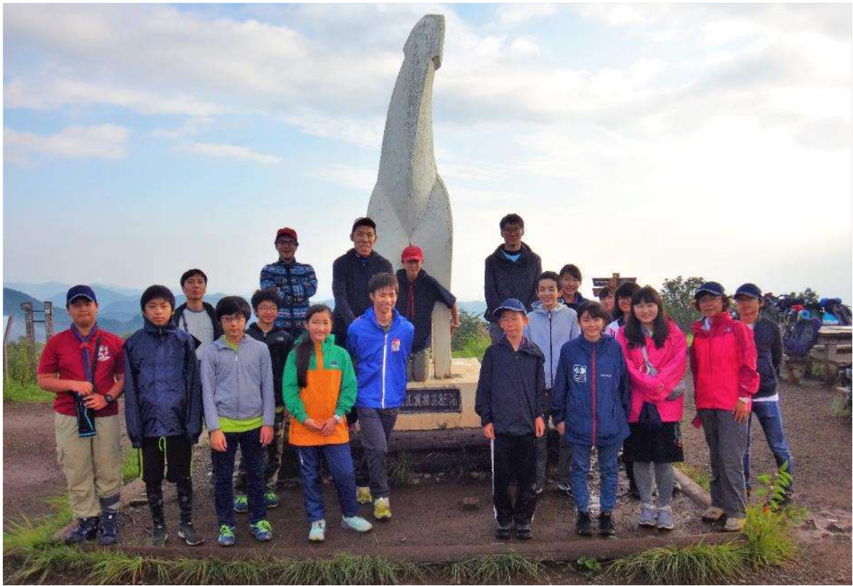
晴れ間も出てきて、白馬の像前で集合写真！