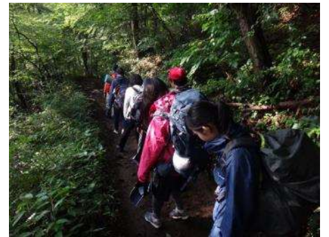
7:00 前には下山開始。寝惚けた様子もなく進んでいます。