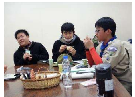
昨夏の日本スカウトジャンボリーを共にした杉並2・3・4団と合流。 我々あすなろ3隊（東京25隊）は合同報告の形式です。 ジャンボリー中の写真を基に、スカウト間で打ち合わせ・リハーサルをしています。