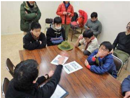
夕方からは本願寺和田堀廟所へ場所を移して「あすなろ地区スカウト報告会」です。