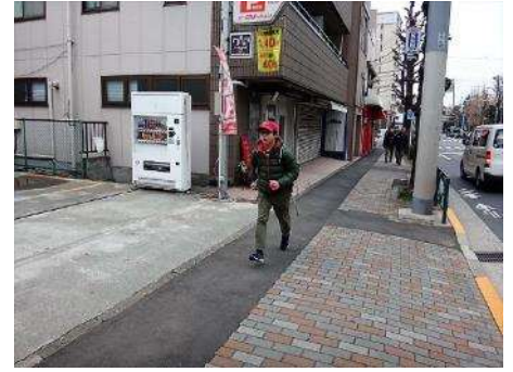
帰りはスカウトペースのテストを実施。